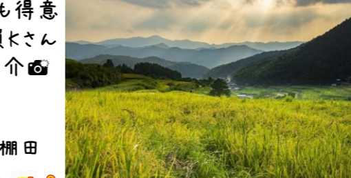
上:彼岸花 下:井手浦棚田