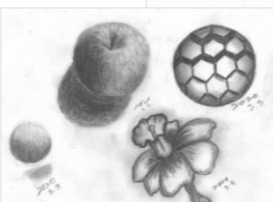
小倉北区 I.T 様