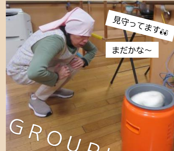
見守ってます◎ まだかな～

[デイ幸神] お客様に餅を丸めて頂きながら昔話♪「昔はこうだったのよ」と、家族で餅つきをしたことを思い出されて会話を楽しまれていました。お客様皆様とスタッフで、酢餅やきな粉餅を食べ、昼食は、豚汁とおむすびを頂き、楽しく過ごされました。