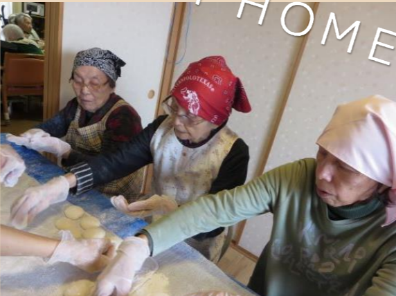
真剣に熱いうちに早く丸めないと…!