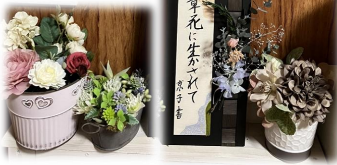
小倉南区 京ちゃん様