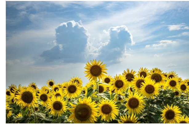
ひまわりと夏雲(小月)

近年は「災害級の暑さ」と言われるほど、危険な猛暑が続いています。命にもかかわる熱中症は屋外だけでなく、室内でも多く発生しています。「私は大丈夫」「まだ我慢できる」という思い込みは非常に危険です△ とくに高齢の方や障害のある方は、暑さを感じにくかったり、体温調節が難しかったりすることがあります。のどの渇きにも気づきにくいいため、「暑さを感じる前」「のどが渇く前」の対策が命を守る鍵になります。