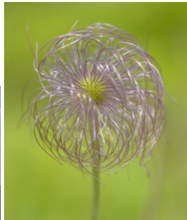
↑ 翁草 \火を噴く煙突 (雲間の太陽) ←ふじ